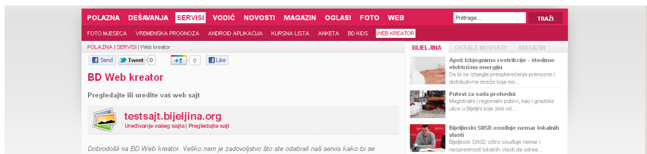
Slika 3 – Linkovi za pregled i uređivanje vašeg web sajta

Nakon što ste završili prethodna 2 koraka možete početi da unosite informacije, takstove, slike, dokumenta ili bilo kakav drugi sadržaj na vaš web sajt. Administraciju web sajta možete da radite bilo kada, sa bilo kog mjesta, a dovoljno je samo da se logujete na bijeljina.org I kliknete na dugme “WEB” u gornjem meniju. Biće vam prikazan vaš web sajt sa linkom “ uređivanje vašeg sajta ” (slika 3).