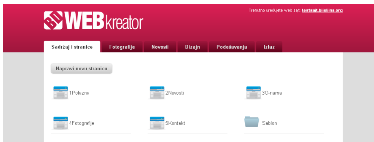
Slika 4 – Izgled osnovnog ekrana BD Kreatora

U BD kreatoru u godnjem desnom uglu prikazana je adresa vašeg sajta I klikom na nju u svakom trenutku možete pogledati kako vaš web sajt izgleda.