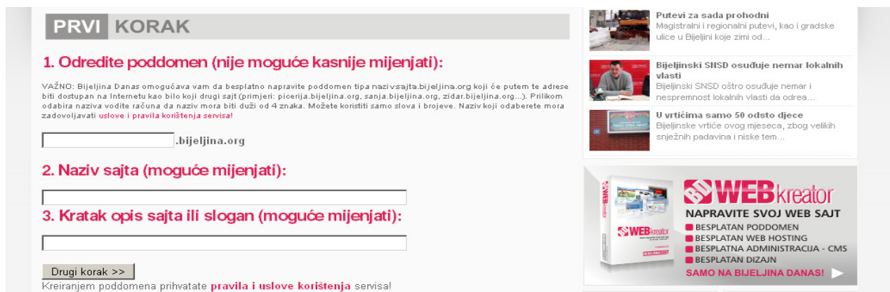
Slika 1. Registracija poddomena